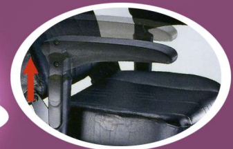
Altura reposabrazos regulable